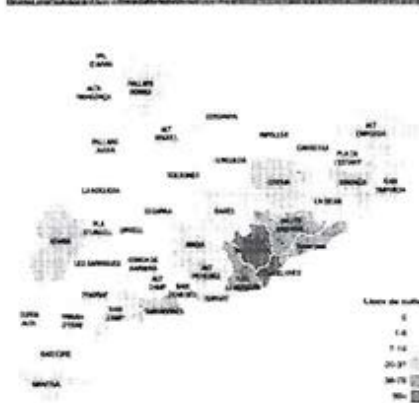
Mapa comarcal de llocs de culte