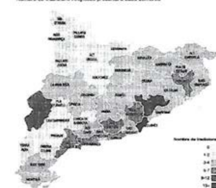
Mapa comarcal de diversitat religiosa Nombre de tradicions religioses presents a cada comarca

L'antic monopoli religiós de l'Església catòlica deixa pas a l'existència de moltes tradicions religioses, amb menor pes però la mateixa legitimitat. Aquesta gran diversitat de religions s'ha classificat de