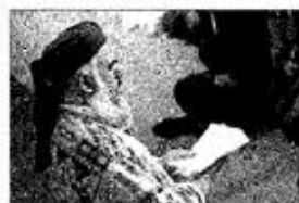
Un imam a la festa islàmica del xai al Raval

■ El govern està treballant en una llei de centres de culte per omplir aquest buit legal, tenint en compte la proliferació d'espais vinculats a comunitats religioses. Una llei que, segons Carod-Rovira, haurà de garantir tant les condicions de segu-