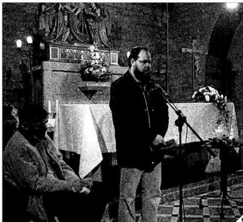
1. Pregària multireligiosa per la pau a Manresa 2. Festa del xai de la comunitat musulmana 3. Desfilada tibetana per Barcelona