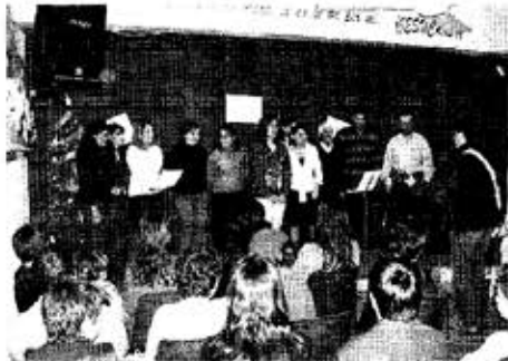
Una de les celebracions al centre de Valls.

de l'Església evangèlica són les denominades cèl·lules, les reunions dels membres de la congregació que realitzen als seus domicilis, on estudien la Bíblia i fomenten la comunió i la relació entre ells mateixos. L'església de Valls té en la comunió entre els seus membres un dels pilars més importants de la seva comunitat, i moltes de les activitats tenen com a objectiu l'atenció dels assistents.