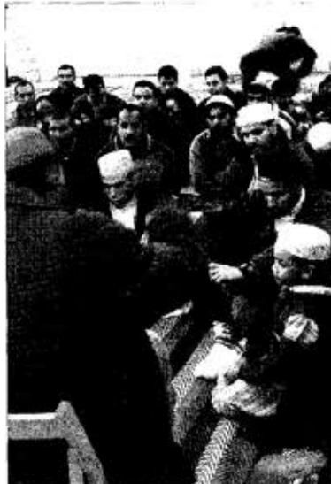
A l'esquerra, un grup de fidels musulmans resant a la mesquita improvisada a Tortosa. A la dreta, quadre de tots els llocs de culte a l'Ebre.

Un altre fet significatiu arreu de les comarques de l'Ebre és l'increment de la confessió ortodoxa, a causa de l'arribada de fidels d'aquesta religió provi-