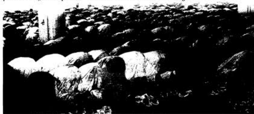
Fidels islàmics congregats durant la finalització del ramadà al Palau Firal de Manresa

(*) No es disposa de les dades referents a l'Església catòlica el 2004. L'any 2007 només es van comptar els centres de culte habitual. L'any 2010 es compten tots els centres de culte catòlic.