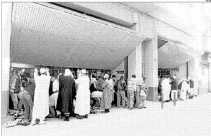
Foto d'arxiu de la mesquita del carrer del Nord de Lleida.

■ Els centres de culte islàmics pràcticament s'han duplicat a la província de Lleida durant els últims sis anys, al passar de 10 el 2004 a 19 el 2010.