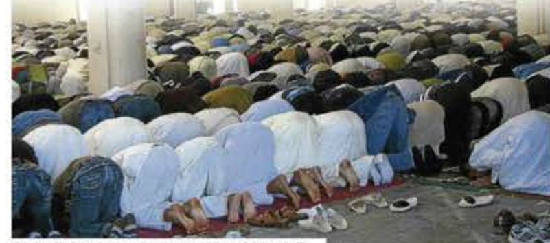
El Palau Firal de Manresa durant una celebració del ramadà

► Cal diferenciar entre Solsona i Guissona, ja que en aquesta darrera població gairebé tots els romanesos treballen a la Cooperativa de Guissona. Però en el cas del Solsonès, la crisi ha comportat que molts romanesos se'n tornin a casa després d'uns mesos de buscar feina infructuosament. ► Continuen celebrant els oficis religiosos a la sala que els cedeix la parròquia de Solsona? ► Sí. Els ortodoxos, però, donem molta importància a la iconografia, a les imatges; i això ens suposa un inconvenient.