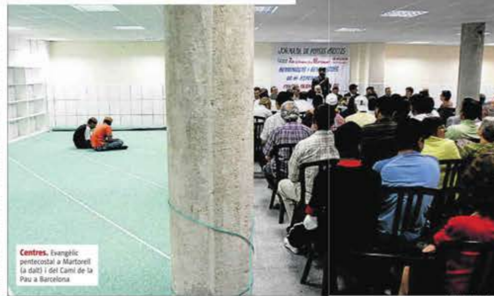
Centres. Evangèlic pentecostal a Martorell (a dalt) i del Camí de la Pau a Barcelona

En canvi continuen amb tendència lleugerament a la baixa els testimonis cristians de Jehovà, que van passar dels 147 centres del 2007 als 131 del 2010 i als 126 del 2013. Tanmateix, el mapa comarcal dels Salons del Regne indica un gran equilibri. Només