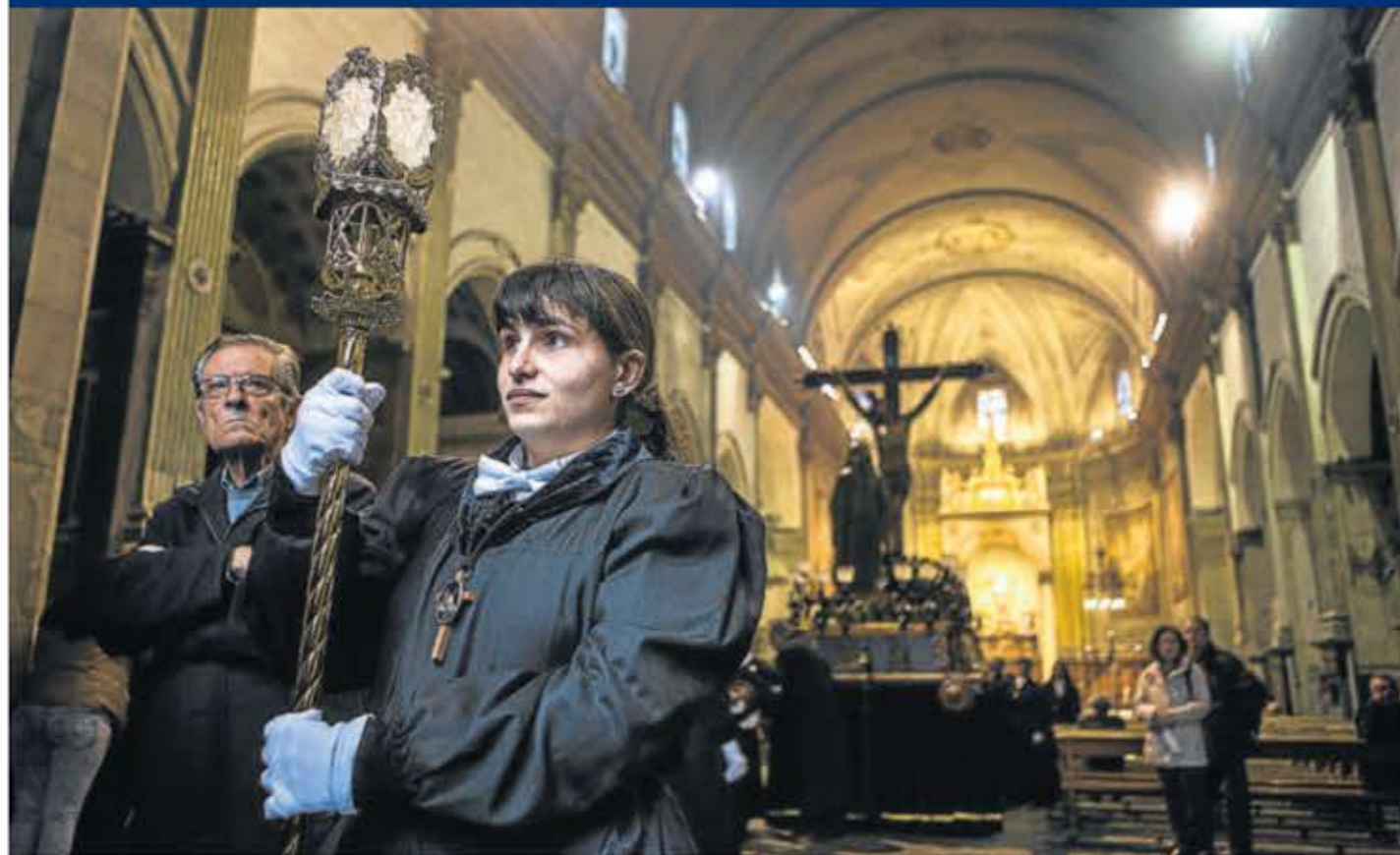
La celebració de la Setmana Santa. Processó de Divendres Sant durant la celebració, el passat dia 3, de la Setmana Santa a Mataró, amb presència de diverses confraries i els Armats de Mataró. Les processons són una tradició cristiana que manté les arrels populars.